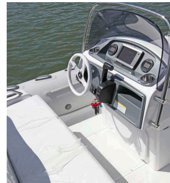
Centralno postavljena krmarska konzola je udobna, pregledna in ima dovolj visoko vetrobransko steklo.

Kanadski proizvajalec Grand je del proizvodnje preselil v Ukrajino. Rezultat so kvalitetni in cenovno dostopni čolni.